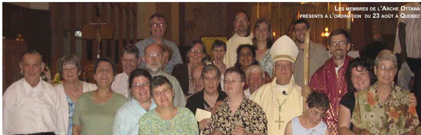
LES MEMBRES DE L'ARCHE OTTAWA PRÉSENTS À L'ORDINATION DU 23 AOÛT À QUÉBEC